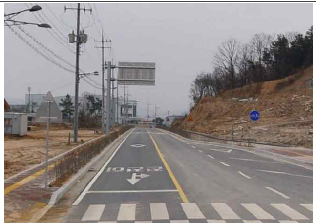
[위치도 또는 완료전경]