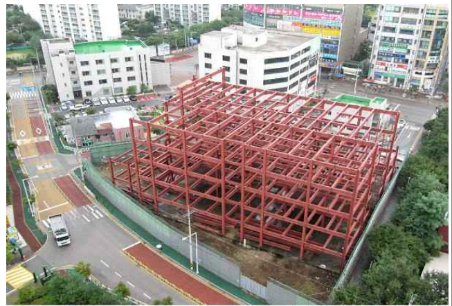
[위치도 또는 완료전경]